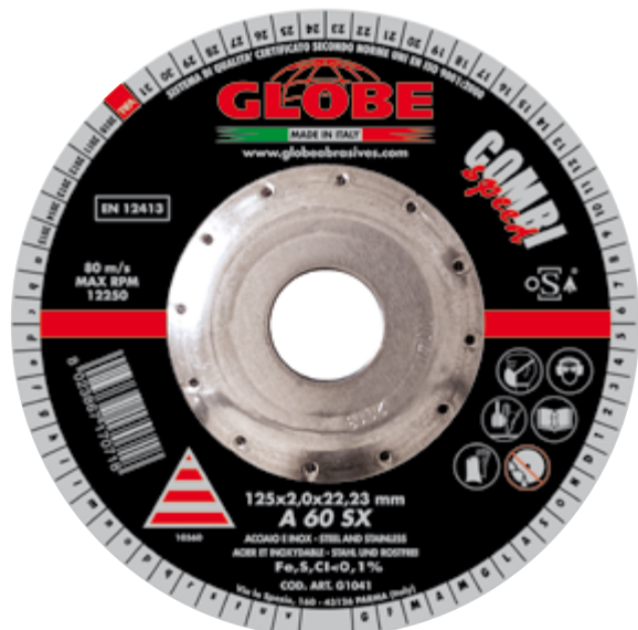
Combi Speed A 60 SX Ø 115, Ø 125 (x2,0 x 22,23mm)