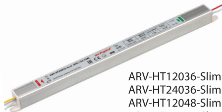
ARV-HT12036-Slim ARV-HT24036-Slim ARV-HT12048-Slim ARV-HT24048-Slim