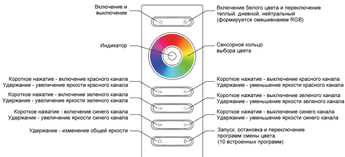
Рис.1. Функции пульта.