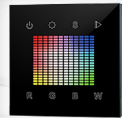
арт.021036 SR-2831S-AC-RF-IN Black