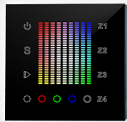
арт.020585 SR-2831AC-RF-IN Black