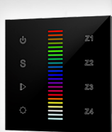
арт.019575 SR-2830RGB-RF-IN Black