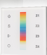
арт.017915 SR-2830RGB-RF-IN White