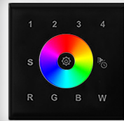
арт.018069 SR-2820AC-RF-IN Black