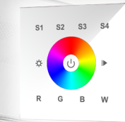
арт.021038 SR-2820B-AC-RF-IN White