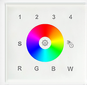
арт.017857 SR-2820AC-RF-IN White