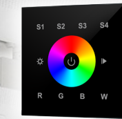
арт.021037 SR-2820B-AC-RF-IN Black