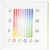
арт.018202 SR-2831AC-RF-IN White