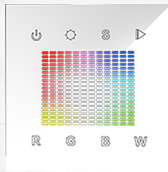
арт.018277 SR-2831S-AC-RF-IN White