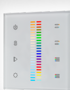
арт.021035 SR-2830C-AC-RF-IN White