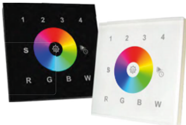
BLACK / WHITE