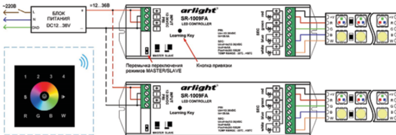
Схема подключения контроллеров на примере SR-1009FA.