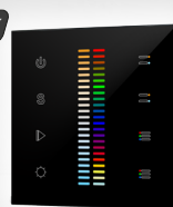
арт.019062 SR-2830C-AC-RF-IN Black