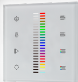
арт.020951 SR-2830C1-AC-RF-IN White