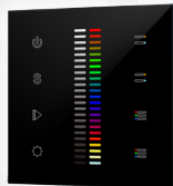
арт.020950 SR-2830C1-AC-RF-IN Black