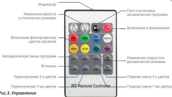
Рис.3. Управление контроллером.