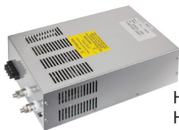
HTS-1500-12 HTS-1500-24 HTS-1500-48

В металлическом корпусе УЛЬТРАМОЩНЫЕ С вентилятором