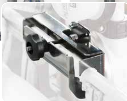
Steel support IBC brachet