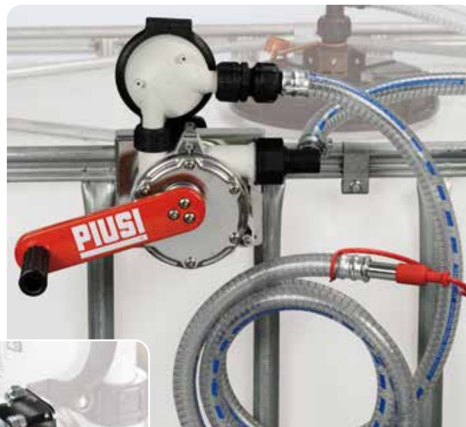
With filter version