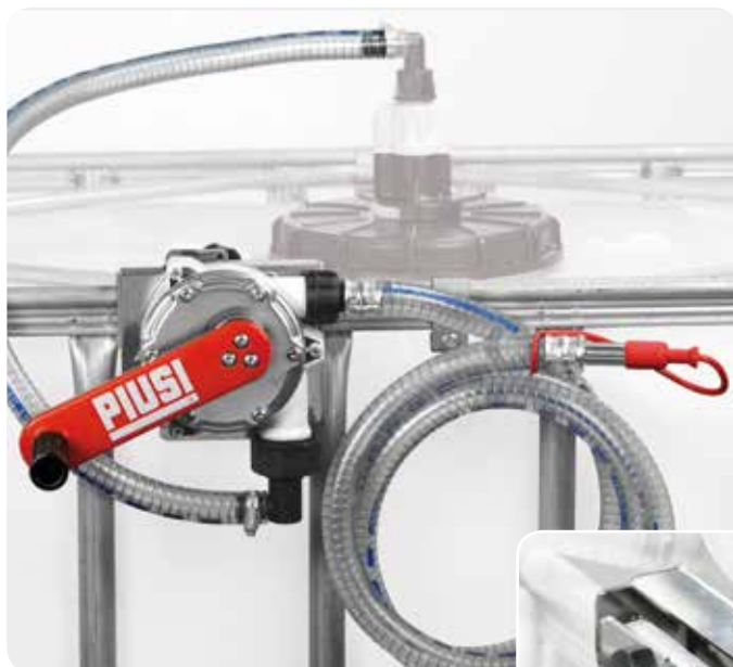
Without filter version