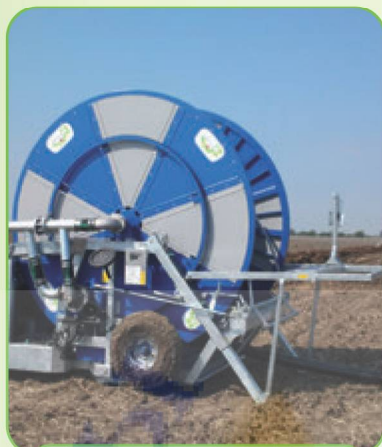
ГИДРАВЛИЧЕСКИЙ ПРИВОД ОПОРНЫХ ЛАПОК