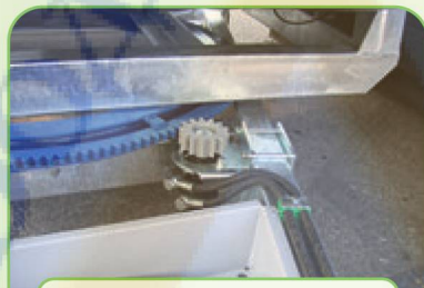
ГИДРАВЛИЧЕСКИЙ ПРИВОД ПОВОРОТА ПЛАТФОРМЫ