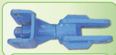
СПЕЦИАЛЬНАЯ БУКСИРНАЯ СЕРЬГА