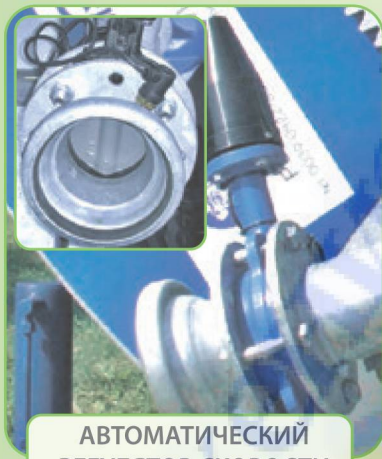
АВТОМАТИЧЕСКИЙ РЕГУЛЯТОР СКОРОСТИ