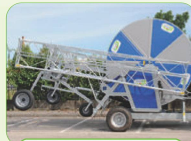
КОНСОЛИ ДЛЯ ПОЛИВА