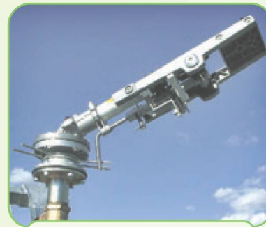
СПРИНКЛЕРЫ ПО ЗАКАЗУ