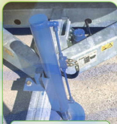
ОПОРНАЯ ЛАПКА НА ДЫШЛЕ С ГИДРАВЛИЧЕСКИМ ПРИВОДОМ