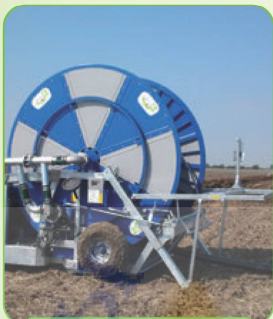
ГИДРАВЛИЧЕСКИЙ ПРИВОД ОПОРНЫХ ЛАПОК