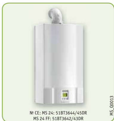
№ CE: MS 24: 51BT3644/45DR MS 24 FF: 51BT3642/43DR