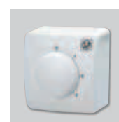
Настенный пульт управления. Размеры ДхШхВ (мм): 80x80x70

Вентиляторы очень просты в установке, имеют три скорости вращения и трехскоростной настенный проводной пульт управления в комплекте. В зависимости от схемы подключения, вентилятор может работать с потоком воздуха вниз или вверх.