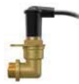
Электрод Устанавливается на заводе