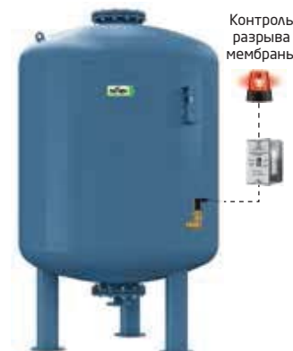
Контроль разрыва мембраны