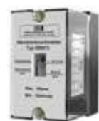
Реле Устанавливается на стене (монтаж на месте)