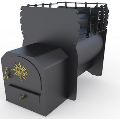
рис. 3 Затея