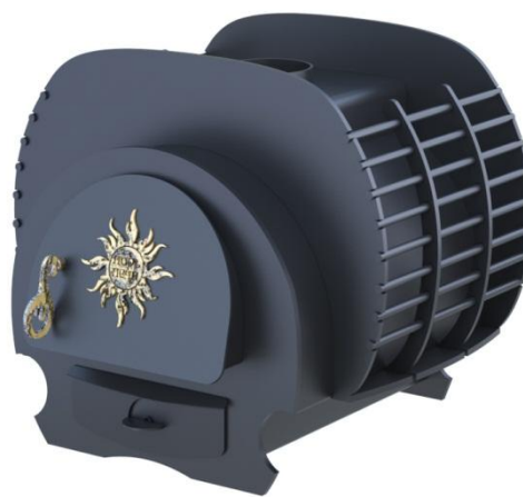
рис. 8 Малуша