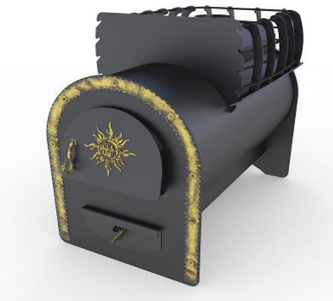
рис. 5 Горыня