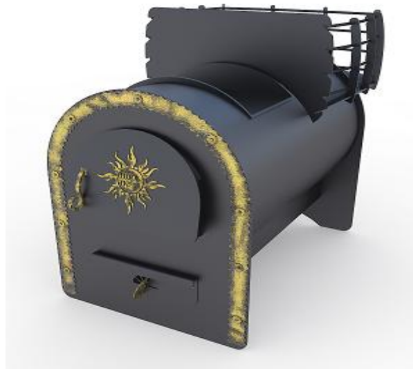
рис. 4 Любана