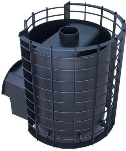
рис. 1 Вольга