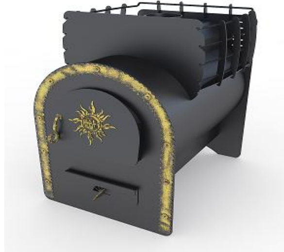
рис 2 Забава