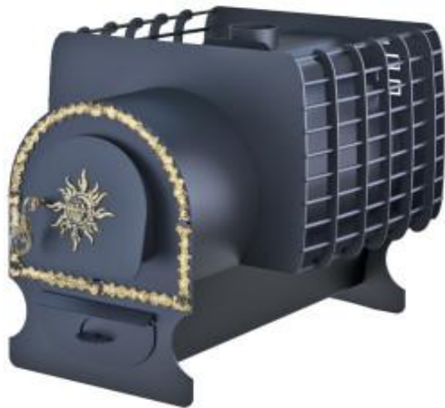
рис. 7 Святогор