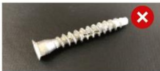
Пример некачественной крепежной фурнитуры