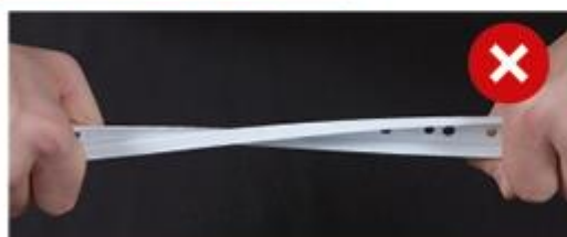
Пример некачественной фурнитуры