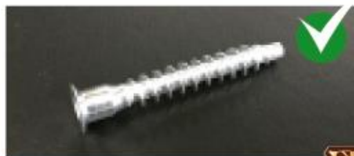
Пример качественной крепежной фурнитуры

Также обращайте внимание на внешний вид крепежных элементов. Так, к примеру, резьба качественных болтов должна быть ровной, без извилин, загибов и разрывов. Сколы, трещины и прочие дефекты