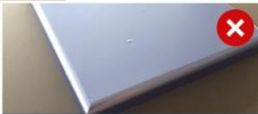
Пример некачественного МДФ