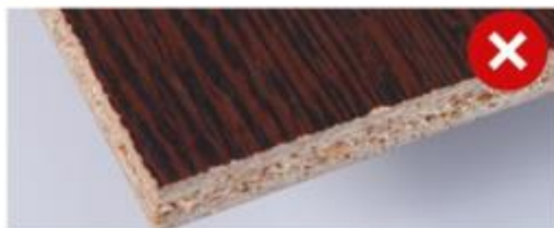
Пример некачественного распила ЛДСП