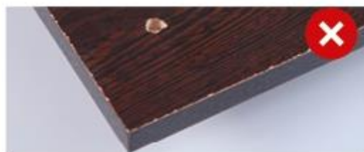
Пример некачественной кромки и сверления