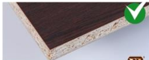
Пример качественного распила ЛДСП

Основной материал для производства корпусной мебели — это ЛДСП (ламинированная древесно-стружечная плита). Обязательно запросите сертификат на этот материал. Главными критериями качества плиты является уровень эмиссии формальдегида. Этот показатель должен соответствовать классу E1, который согласно ГОСТа разрешен для изготовления детской мебели. Если при покупке мебели Вам отказывают предоставить сертификат качества на используемый материал, то от-