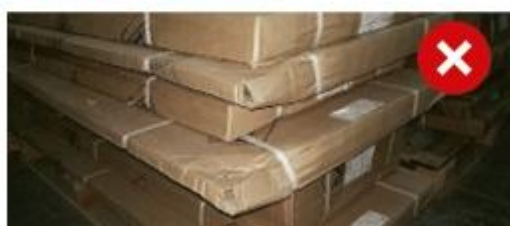
Пример некачественной упаковки