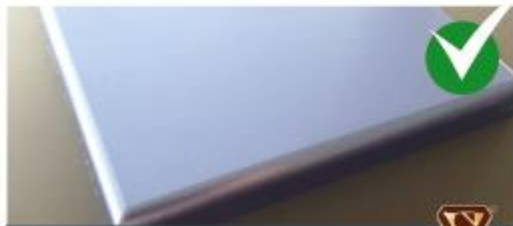
Пример качественного МДФ

Качественная плита МДФ обладает повышенной устойчивостью к воздействию влаги, сохраняет форму при температурных колебаниях. Обязательно проведите внешний осмотр: убедитесь, что поверхность гладкая и не имеет сколов;