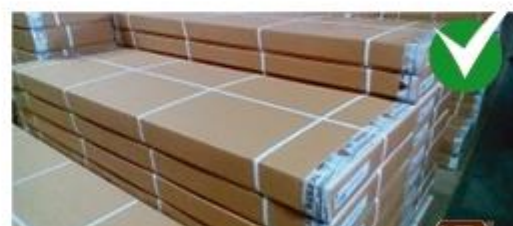
Пример качественной упаковки

Обратите внимание, как упакована мебель, нет ли визуальных повреждений? Упаковка гарантирует сохранность мебели при транспортировке и хранении. На