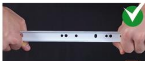
Пример качественной фурнитуры

Следующее, на что стоит обратить внимание – это фурнитура. Именно от её качества зависит долговечность работы створок, плавность хода ящиков и, конечно же, удобство использования мебели. Преимуществом качественной фурнитуры является долговечность. Петли должны иметь несколько слоёв защитного покрытия и усиленную