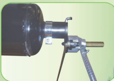
ПРИСПОСОБЛЕНИЕ ДЛЯ ЗАПОЛНЕНИЯ НАСОСА