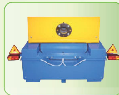
СВЕТОВАЯ СИГНАЛИЗАЦИЯ ДЛЯ ПЕРЕДВИЖЕНИЯ ПО ДОРОГАМ