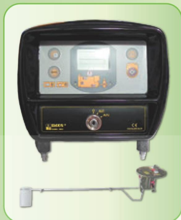
ПАНЕЛЬ УПРАВЛЕНИЯ SEM 250-256