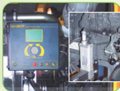
ПАНЕЛЬ УПРАВЛЕНИЯ IDROMOP