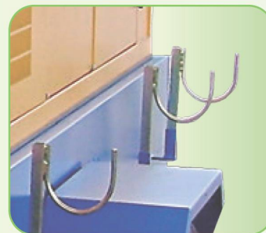
ОПОРЫ ДЛЯ ТРУБ