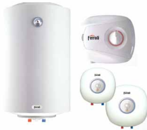
Рис.1. Внешний вид ЭВН

Водонагреватель оборудован штатным сетевым шнуром электропитания с вилкой и УЗО. Электрическая розетка должна иметь контакт заземления с подведенным к нему проводом заземления и располагаться в месте, защищенном от влаги, или удовлетворять требованиям по влаго- и брызгозащищенности. Вставить вилку в розетку и нажать кнопку, расположенную на УЗО ( опционно ).