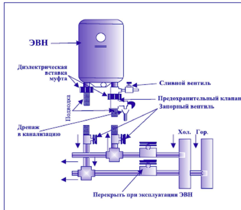
Рис. 2. Схема подключения ЭВН к водопроводу

7.3. При соблюдении правил установки, эксплуатации и технического обслуживания ЭВН и соответствии качества используемой воды действующим стандартам изготовитель устанавливает на него срок службы 10 лет.