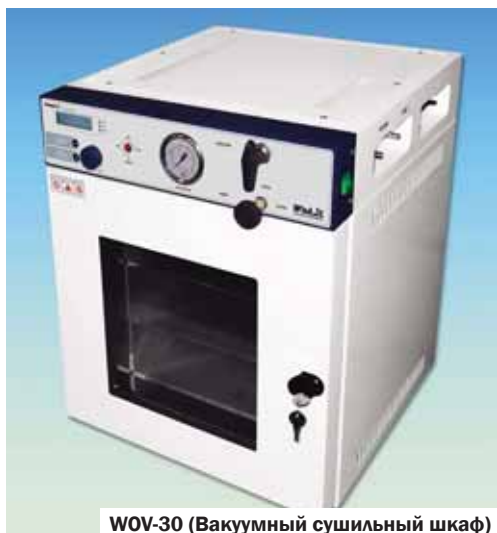
WOV-30 (Вакуумный сушильный шкаф)