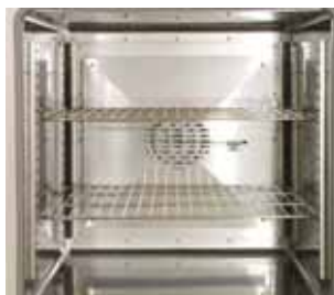
Камера сушильного шкафа с вентилятором принудительной конвекции

Кабель для RS232 и ПО для подключения к ПК