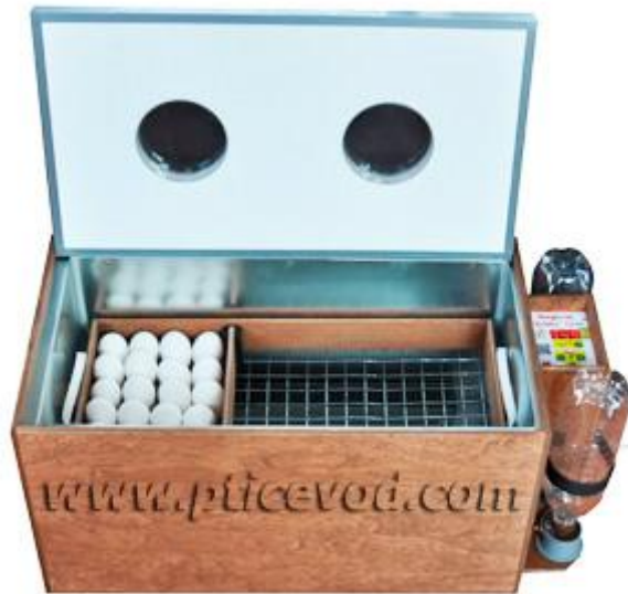
Инкубаторы автоматические бытовые: «БЛИЦ» 72 и 48