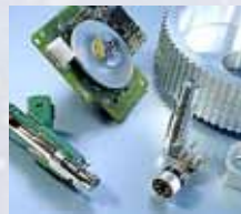
Очистка деталей в промышленности, в цехах и сервисах