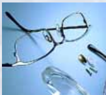
Ультразвук в офтальмологии и оптики