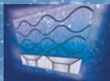
Система Sweep (режим частотной модуляции)