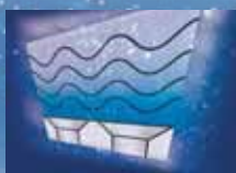
Система ультразвуковых преобразователей