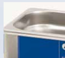
Метка уровня заполнения

■ Дополнительный нагреватель, способный работать при незаполненной ванне, облегчает процесс очистки