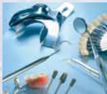
Очистка в стоматологической и медицинской отрасли