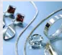
Ультразвуковая очистка в ювелирной отрасли