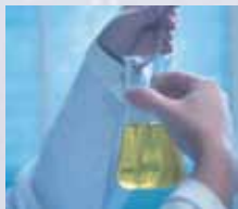
Очистка, дегазация и диспергирование в лабораториях