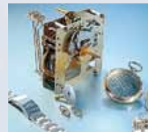
Ультразвук в часовой отрасли

■ Лаборатория: Ультразвук очищает везде, где может применяться очищающая жидкость. Это особенно подходит для очистки лабораторных инструментов сделанных из стекла, пластмассы или металла.