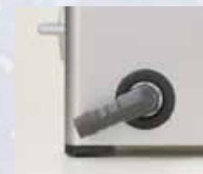
Позиционируемая сливная труба