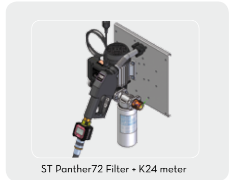
ST Panther72 Filter + K24 meter