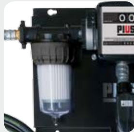
Available with Clear Captor Filter