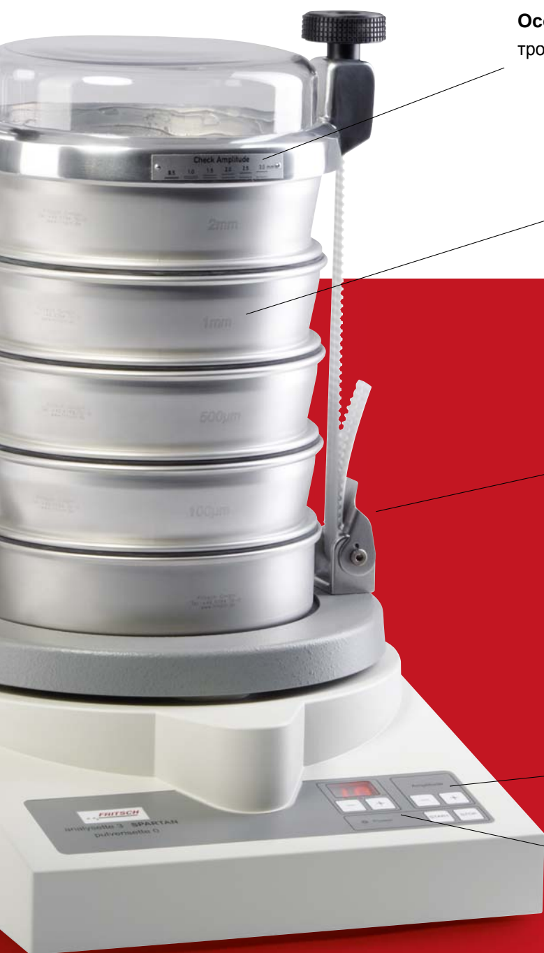
ANALYSETTE 3 SPARTAN

Задание времени отсева при помощи прецизионного цифрового таймера на эргономичной панели управления.