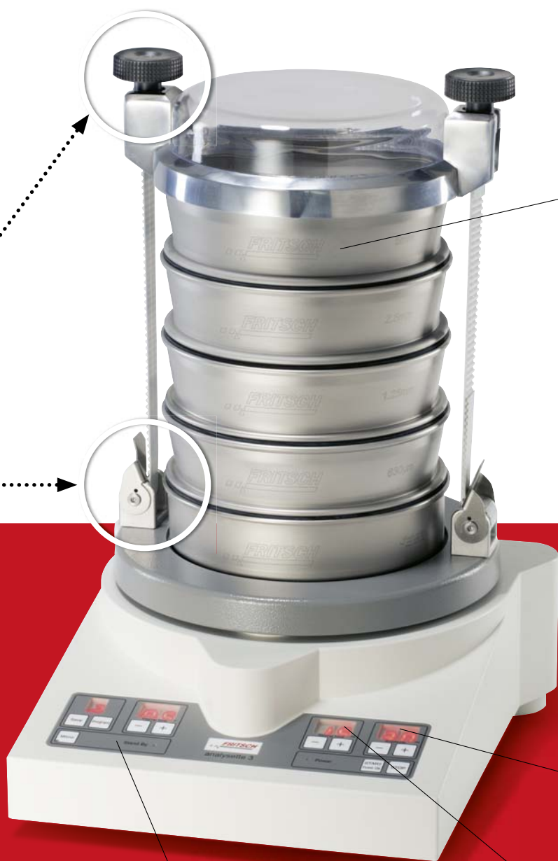
ANALYSETTE 3 PRO

Плюс от FRITSCH Функция AMP-CONTROL для настройки постоянной амплитуды, которая автоматически контролируется и регулируется. Ваше преимущество: гарантированная стабильность амплитуды и благодаря этому точно воспроизводимые результаты отсева в соответствии с DIN 66165, а также возможность калибровки и проверки вашего прибора ANALYSETTE 3 PRO в качестве средства контроля а соответствии с требованиями ISO 9001.