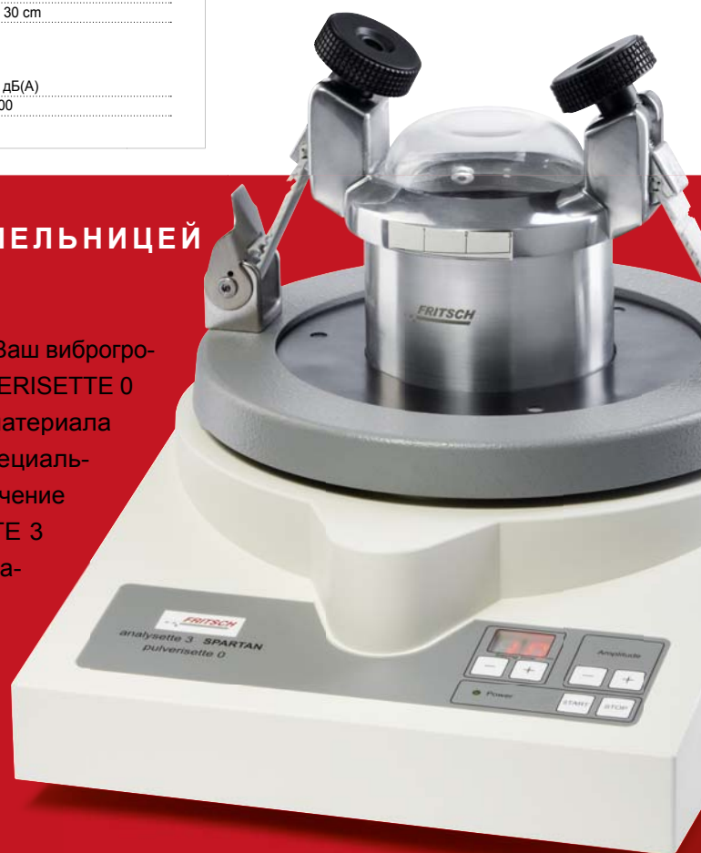
Вибрационная микромельница PULVERISETTE 0