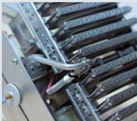
Розжиг от запальника