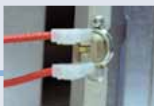
Защита от отсутствия тяги в дымоходе