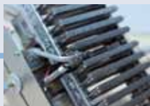
Ионизационный контроль пламени