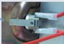
Защита от перегрева