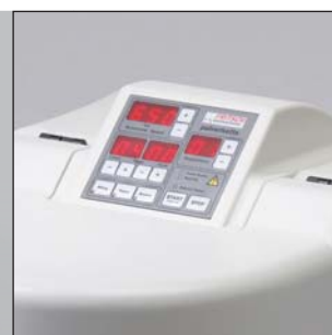
Практично: пленочная клавиатура с возможностью управления при закрытой мельнице