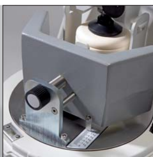
Балансировка за счет простой компенсационной механики

Общая потребляемая мощность 100-120/200-240 В/1~, 50-60 Гц, 1100 ватт Мощность вала двигателя по VDE 0530, EN 60034 0,75 кВт Вес нетто 63 кг брутто 83 кг Габариты Ш x Г x В настольная модель: 37 x 53 x 50 см Упаковка Ш x Г x В деревянный ящик: 68 x 54 x 72 см Значение звуковой эмиссии на рабочем месте прим. до 85 дБ(А) (в зависимости от измельчаемого материала, используемых размольных стаканов/шаров, выбранного числа оборотов) № для заказа 06.2000.00