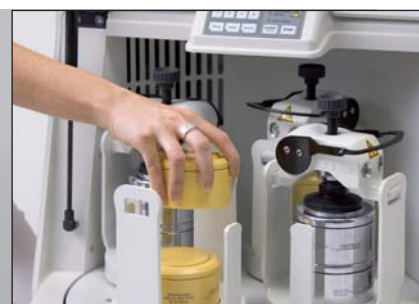
Особенно экономит время: одновременное измельчение до 8 проб