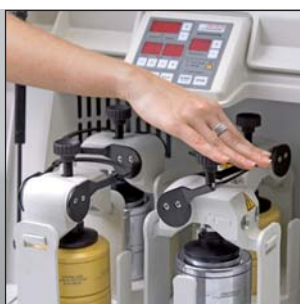
Быстро и надежно: практичная система Safe-Lock