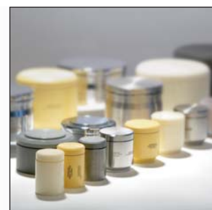
Особенно многосторонняя: программа размольных стаканов фирмы FRITSCH