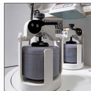
Также возможно: p-5 classic line с 2 местами для размольных стаканов