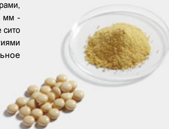
Таблетки перед измельчением и после измельчения в PULVERISETTE 14 с ударным кольцом и кольцевым ситом 2 мм с трапецидальными отверстиями при 20000 об/мин

Для подготовки проб по RoHS – напр., для подтверждения наличия 6-валентного хрома, оснастите PULVERISETTE 14 ротором с 12 ребрами с покрытием из карбида вольфрама и кольцевым ситом с покрытием из карбида вольфрама с трапецидальными отверстиями.