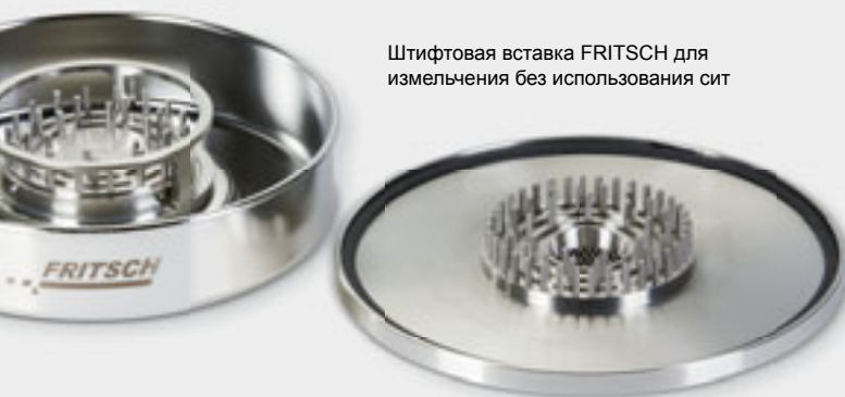
Штифтовая вставка FRITSCH для измельчения без использования сит

А это есть только у FRITSCH: Для измельчения без использования сит самых сложных, среднетвердых, содержащих масло или жир материалов, таких как воск или парафин, оснастите PULVERISETTE 14 уникальным штифтовым ротором и подходящей крышкой камеры измельчения с штифтовой вставкой для измельчения без применения кольцевого сита.