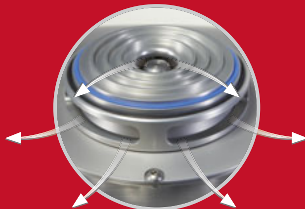
Система подачи воздуха для эффективного охлаждения пробы

А это есть только у FRITSCH: Система направления потоков воздуха PULVERISETTE 14 обеспечивает постоянство потока воздуха для охлаждения ротора, всех компонентов двигателя, а также измельчаемого материала в приемном сосуде. Одновременно более мощный вентилятор, который подает в мельницу охлаждающий воздух через поролоновый фильтр частиц создает избыточное давление и предотвращает, таким образом, проникновение загрязняющих частиц из окружающего воздуха.