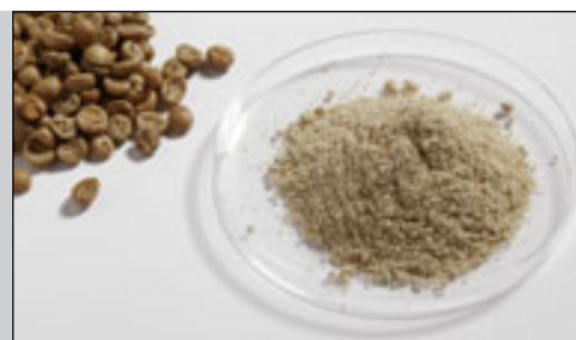
Сырой кофе перед измельчением и после измельчения в P-14 с кольцевым ситом с 1 мм трапециевидной перфорацией при 20000 об/мин