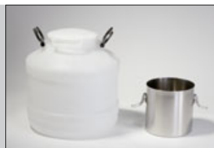
Большой приемный сосуд 30 л, малый приемный сосуд 5 л