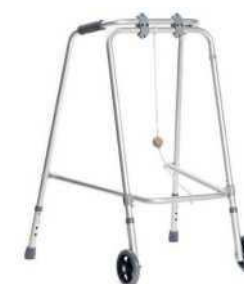
Ходунки алюминиевые складные с мячом – 2 колеса Модель: AR-009