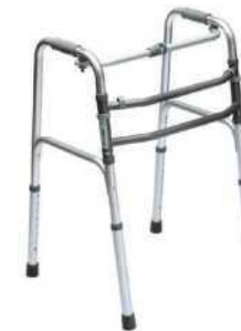
Ходунки алюминиевые складные .Шагающие - Устойчивые. Двойная Н-образная рама Модель: AR-002