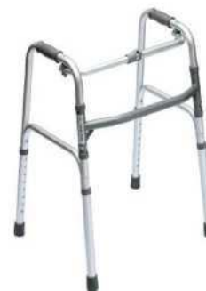
Ходунки алюминиевые складные .Шагающие - Устойчивые. Одиночная Н-образная рама Модель: AR-001