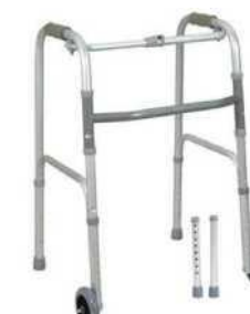
Ходунки алюминиевые складные – 3 функции Модель: AR-008

Изготовитель: ARMEDICAL S.C. Ул. Розьдзеньского 19, 41-303 Домброва-Гурница, Польша ul. Rożdżeńskiego 19, 41-303 Dąbrowa Górnicza, Poland тел. факс: +48 32 261 71 36, +48 32 268 63 05 www.armedical.pl , e-mail: biuro@armedical.pl