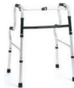
Ходунки алюминиевые складные – двухуровневые Модель: AR-023