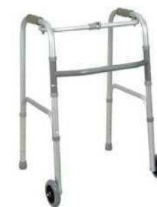
Ходунки алюминиевые складные с двумя колесами Модель: AR-003