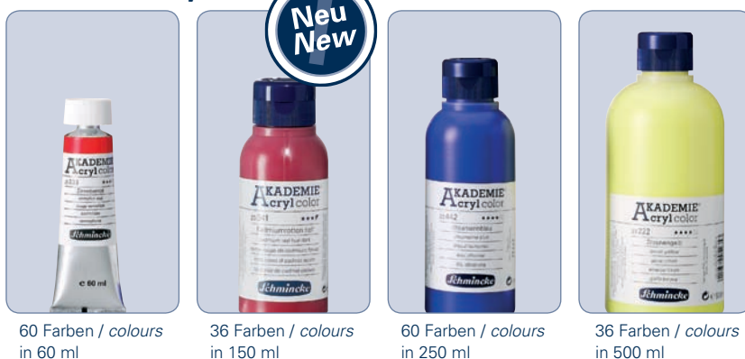
60 Farben / colours in 60 ml