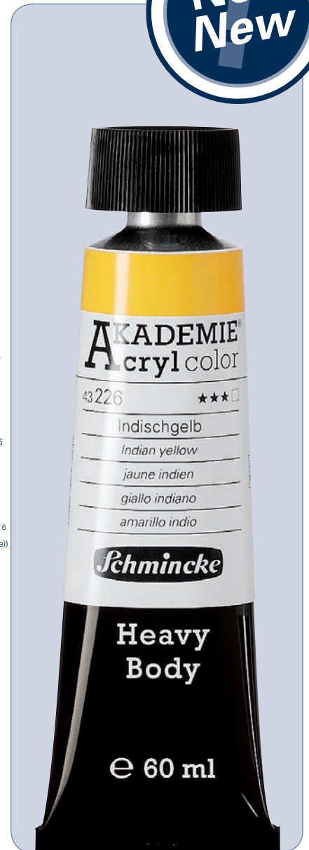
36 Farben / colours in 60 ml