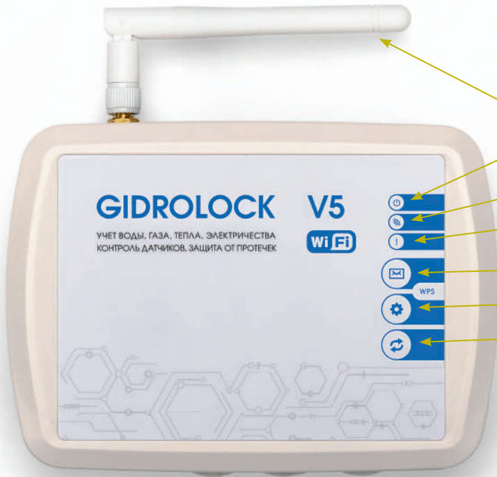
Фото 3. Блок управления GIDROLOCK Wi-Fi V5