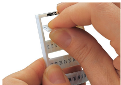
Separating a strip from the WMB or WMB marker card.