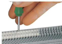
Snapping a WMB marker strip into the marker slot of the double marker carrier.