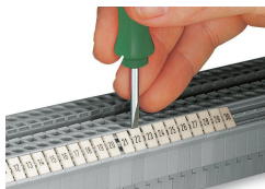
Snapping a marking strip into the marker slot.