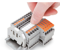
Snapping a marking strip into the marker slot.