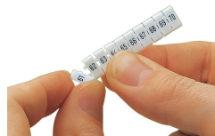
Separating an individual marker from the WMB marker strip – for larger terminal blocks.