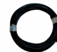
WZ0003 x 0,6m