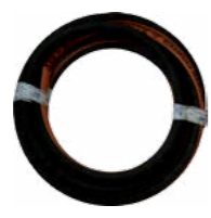
WZ0009 x 10m