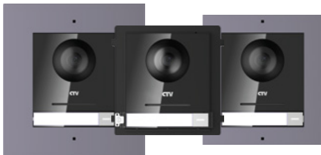
CTV-IP-UCAMF CTV-IP-UCAM CTV-IP-UCAMS