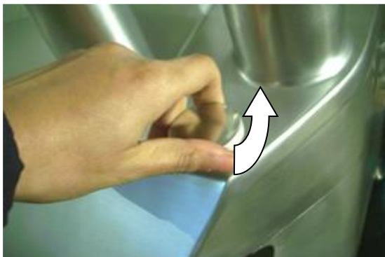
Открывание крышки (3)