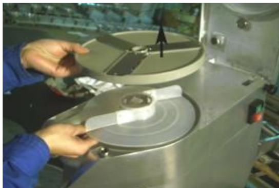
Установка режущей пластины (4)