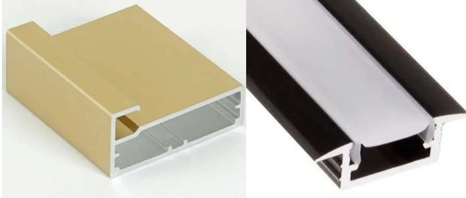
Алюминиевый профиль (створки) / Профиль для LED-подсветки