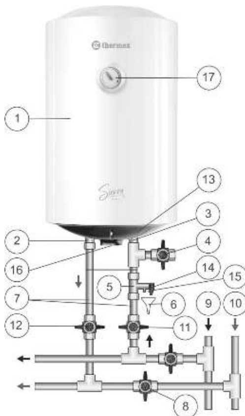
Рисунок 1. Схема подключения ЭВН к водопроводу

Рисунок 1: 1 – ЭВН, 2 – патрубок горячей воды, 3 – патрубок холодной воды, 4 – сливной вентиль, 5 – предохранительный клапан, 6 – дренаж в канализацию, 7 – подводка, 8 – перекрыть вентиль при эксплуатации ЭВН, 9 – магистраль холодной воды, 10 – магистраль горячей воды, 11 – запорный вентиль холодной воды, 12 – запорный вентиль горячей воды, 13 – защитная крышка, 14 – выпускная труба предохранительного клапана, 15 – ручка для открывания предохранительного клапана, 16 – ручка управления, 17 – индикатор температуры.