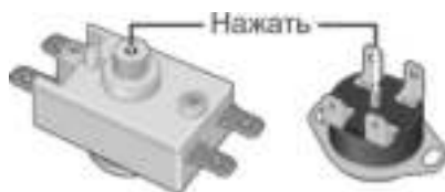
Рисунок 2. Возможные схемы расположения кнопки термовыключателя

Вышеперечисленные неисправности не являются дефектами ЭВН и устраняются потребителем самостоятельно или за его счет.