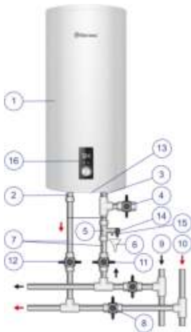
Рисунок 1. Схема подключения ЭВН к водопроводу

Рисунок 1: 1 – ЭВН, 2 – патрубок горячей воды, 3 – патрубок холодной воды, 4 – сливной вентиль, 5 – предохранительный клапан, 6 – дренаж в канализацию, 7 – подводка, 8 – перекрыть вентиль при эксплуатации ЭВН, 9 – магистраль холодной воды, 10 – магистраль горячей воды, 11 – запорный вентиль холодной воды, 12 – запорный вентиль горячей воды, 13 – защитная крышка, 14 – выпускная труба предохранительного клапана, 15 – ручка для открывания предохранительного клапана, 16 – панель управления.