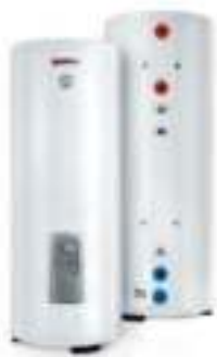
Комбинированные (кос- венные) водонагреватели