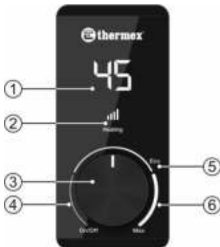
Рисунок 2. Панель управления

Рисунок 2: 1 – LED индикация температуры нагрева, 2 – индикация режима нагрева, 3 – регулятор температуры, 4 – зона «On/Off» / включение/выключение, 5 – зона режима «Eco», 6 – зона режима «Max».