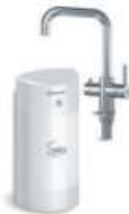
Мультипот система кипячения питьевой воды