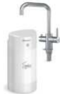
Мультипот система кипячения питьевой воды