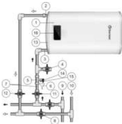
Рисунок 2. Схема подключения ЭВН к водопроводу в горизонтальном положении