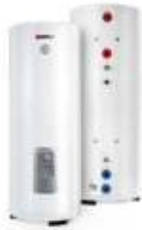
Комбинированные (коч- венные) водонагреватели