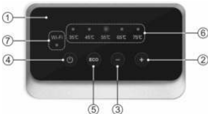
Рисунок 2. Панель управления

Рисунок 2: 1 – панель управления, 2 – кнопка «+», установка увеличенной температуры нагрева (35-45-55-65-75°C), 3 – кнопка «-», установка уменьшенной температуры нагрева (75-65-55-45-35°C), 4 – кнопка «I/O» / включение/выключение, 5 – кнопка «ECO» - установка заданной температуры нагрева 55°C и запуск функции «SMART CONTROL», 6 – LED индикация температуры нагрева, 7 – LED индикация подключения к сети Wi-Fi.