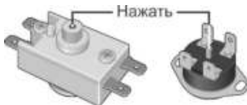
Рисунок 3. Возможные схемы расположения кнопки термовыключателя

Вышеперечисленные неисправности не являются дефектами ЭВН и устраняются потребителем самостоятельно или за его счет.