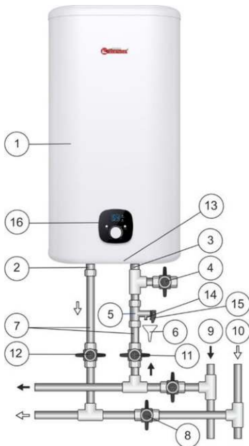
Мал. 1. Схема підключення ЕВН до водопроводу

Підключення до водопровідної системи робиться відповідно до Мал. 1 тільки за допомогою мідних, металопластикових або пластикових труб, а також спеціальної гнучкої сантехпідводки. Забороняється використання гнучкої сантехпідводки що була у користуванні. Рекомендується подавати воду в ЕВН через фільтр-грязьовик, встановлений на магістралі холодної води (не входить в комплект постачання).