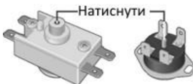
Малюнок 2. Схема розташування кнопки термовимикача

Перераховані вище несправності не є дефектами ЕВН і усуваються споживачем самостійно або за його рахунок.