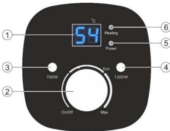
Рисунок 2. Электронная панель управления

1 – LCD дисплей, 2 – Ручка терморегулятора, 3 – Клавиша выбора режима мощности «700W» (0,7 кВт), 4 – Клавиша выбора режима мощности «1300W» (1,3 кВт), 5 – Индикация подключения к сети электропитания «Power», 6 – Индикация нагрева «Heating».