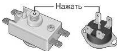
Рисунок 2. Схема расположения кнопки термовыключателя

Вышеперечисленные неисправности не являются дефектами ЭВН и устраняются потребителем самостоятельно или за его счет.