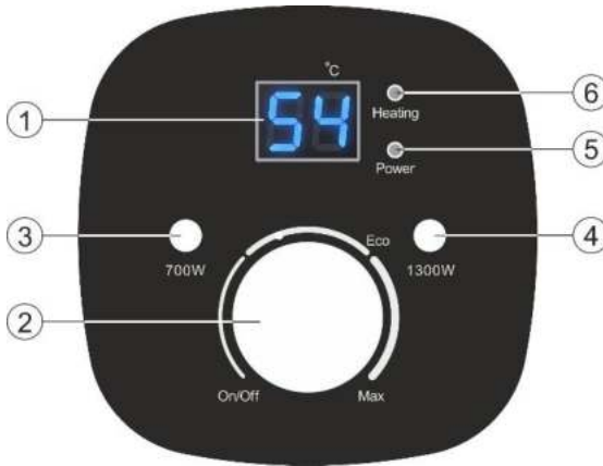
Малюнок 2. Електронна панель керування

1 - LCD дисплей, 2 – Ручка терморегулятора, 3 – Кнопка вибору режиму потужності « 700Вт », 4 - Кнопка вибору режиму потужності « 1300Вт », 5.- Індикація підключення до електромережі « Power », 6 – Індикація нагріву « Heating »