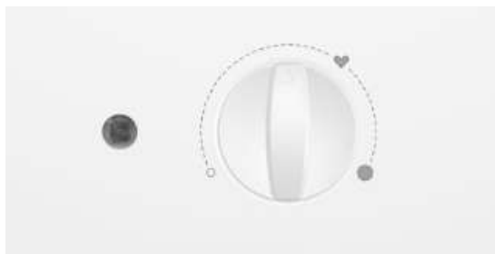
Рисунок 2. Панель управления водонагревателя