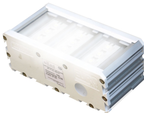
Светильник: ООО "ЕвроЛед ДКУ01-9х1-001 ТУ ВУ 191059198.001-2010 Лампы: 1 x 9 LEDs NICHIA