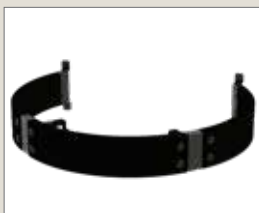
Защитное ограждение SP3