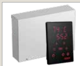
Xenio CX170XW WiFi блок управления (Spirit E)