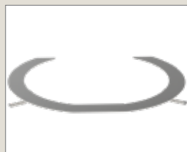
Обод для монтажа внутри полка HSP1