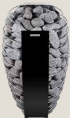
SPiRiT E (Требуется отдельный блок управления)

Каменка для сауны Harvia Spirit модели E с отдельным блоком управления предлагает различные варианты подключения как в условиях домашнего использования, так и при профессиональном пользовании.