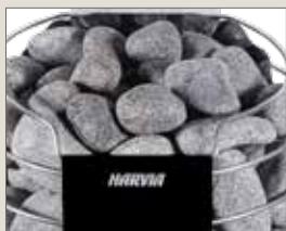
Округлые камни для сауны 5-10 см R-99