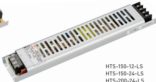
HTS-150-12-LS HTS-150-24-LS HTS-200-24-LS