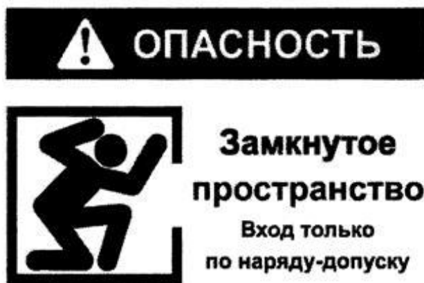
Рекомендуемый знак "ОЗП"