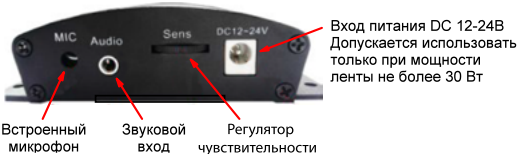
Рис.2. Назначение элементов, расположенных на боковой стороне контроллера.