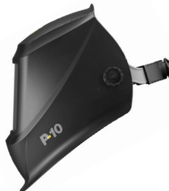
Сварочная маска P10 вид сбоку