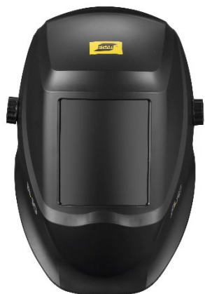
Сварочная маска P10 вид спереди