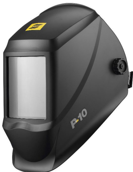
Сварочная маска P10 с постоянным затемнением