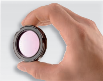
Защитный фильтр для объектива