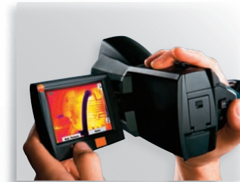
Удобный, откидной, поворотный дисплей

Путем ручного ввода параметров окружающей среды - температуры и влажности воздуха, а также поверхностной температуры - тепловизор рассчитает значение влажности для каждой точки измерения и визуализирует полученные данные посредством термограммы.