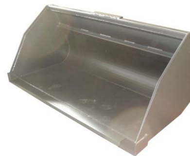
Ковш для легких материалов ВЕ (стандартная комплектация)