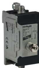
Оригинал может отличаться от изображения